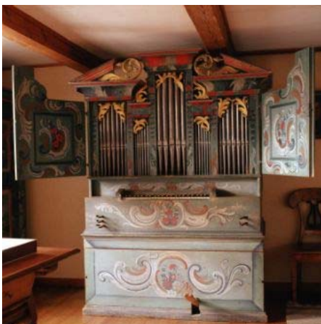
(Hausorgel im Ackerhus)